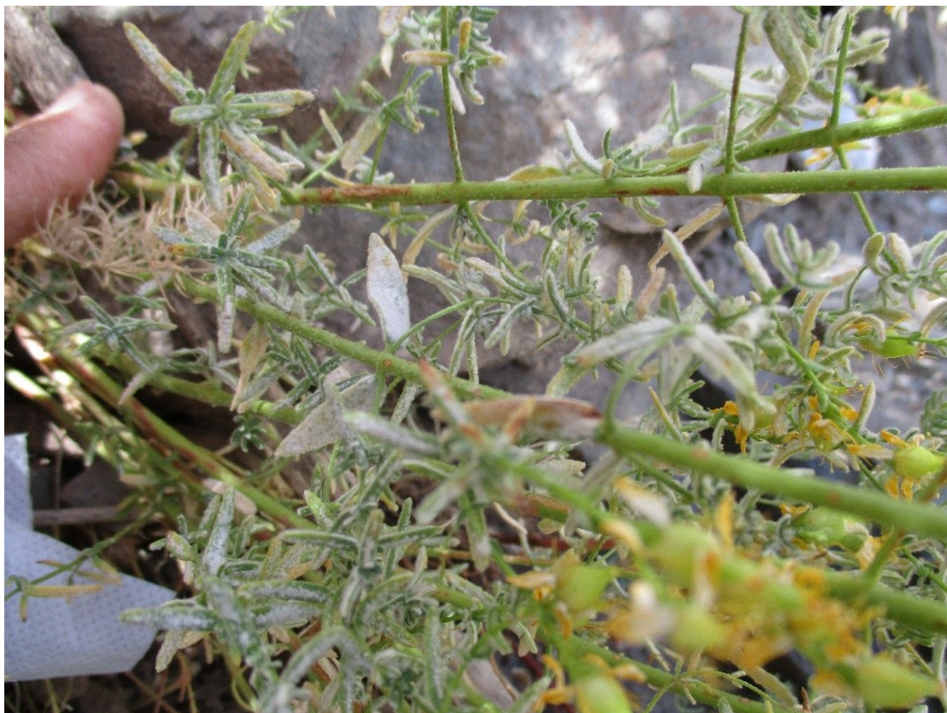
9-rasm. Dalachoyning un-shudring kasalligi

Ta'kidash joizki, nafaqat Zomin milliy tabiat bog'i balki, respublikamizning barcha muhofaza etiladigan tabiiy hududlari, shuningdek o'rmon xo'jaliklarida fitosanitar nazoratni kuchaytirish, o'simliklarda kasallik qo'zg'atuvchi patogen zamburug'larni inventarizatsiya qilish, kasallik o'choqlarini aniqlash, profilaktikasi va qarshi kurash chora-tadbirlarini takomillashtirishni taqozo etadi. Himoya choralari va boshqa tadbirlarni muntazam qo'llamaslik natijasida kasalliklar boshqa hududlarga ham tarqaladi respublikamizning tabiiy boyligi bo'lgan o'simlik va hayvonot dunyosini, tabiiy o'rmonlarni, farmatsevtika sanoatining muhim xom-ashyo bazasi bo'lgan dorivor o'simliklarni yo'qolishiga hamda hududdagi barqaror ekologik muvozanatni buzilishiga olib keladi.