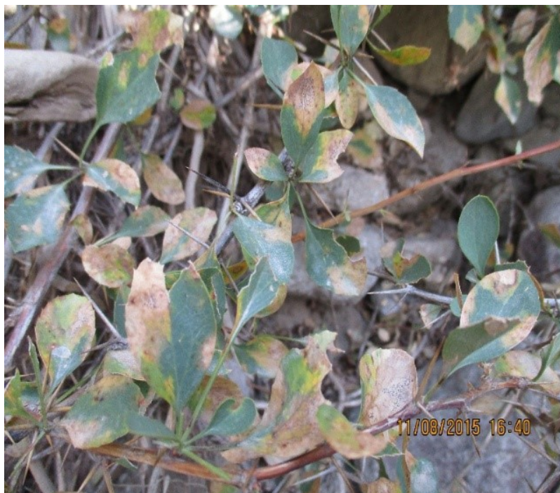
4-rasm. Zirkning septorioz kasalligi

zirkning 50-70 % barglarini zararlashi aniqlandi (4-rasm).