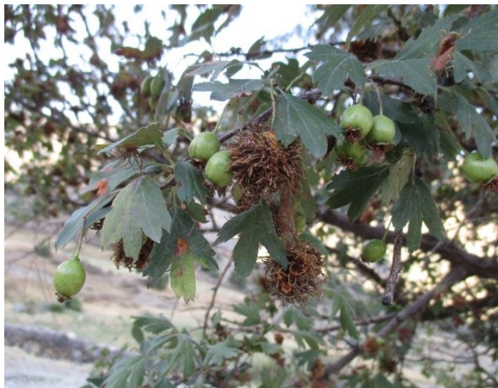
3-rasm.- Do'lananing zang kasalligi