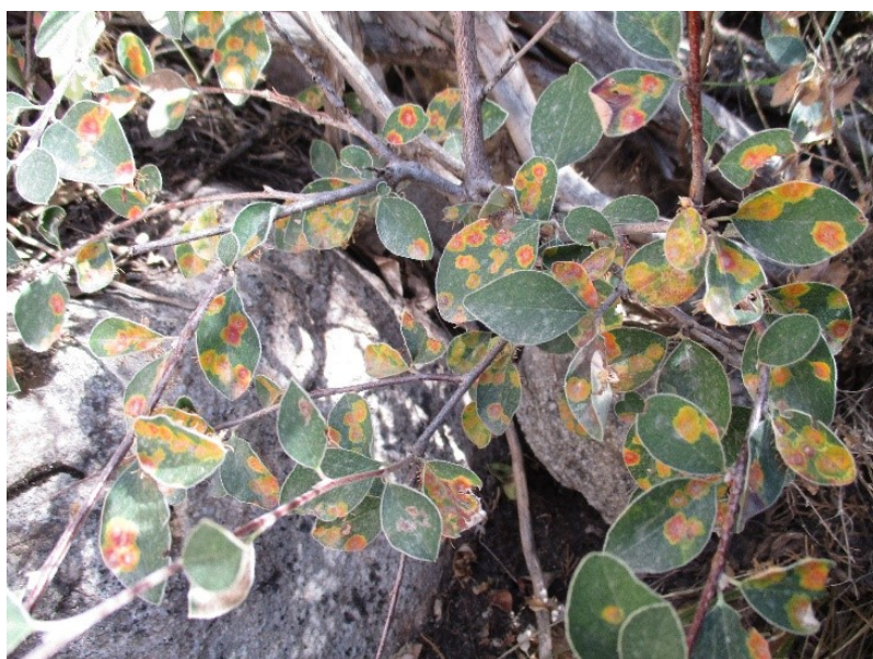
5-rasm. Irg'ayning zang kasalligi

Kasallikning belgilari: dastlab o'simlik barglarining yuzasida, mevalarda mayda, yumaloq, sariq-apelsin rangli dog'lar paydo bo'ladi. Keyinroq ular kattalashib, dog'ning orqa tarafida, ya'ni bargning orqa tomonida hamda mevalar yuzasida 3-7 mm uzunlikdagi silindrsimon, jigarrang o'simtalar hosil bo'ladi(5-rasm).