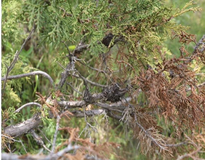
1-rasm. Archaning zang kasalligi

Archa tanasining chirish kasalligi ( Hyphodontia zhixiangii sp. nov. Fisch) kasalligi.