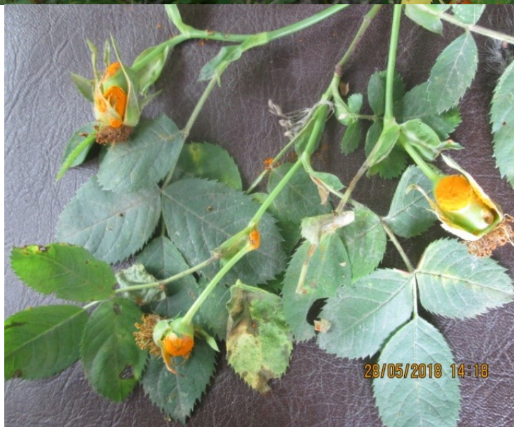
7-rasm. Na'matakning zang kasalligi

Dalachoyning un-shudring ( Leveillula guttiferarum Golovin) kasalligi