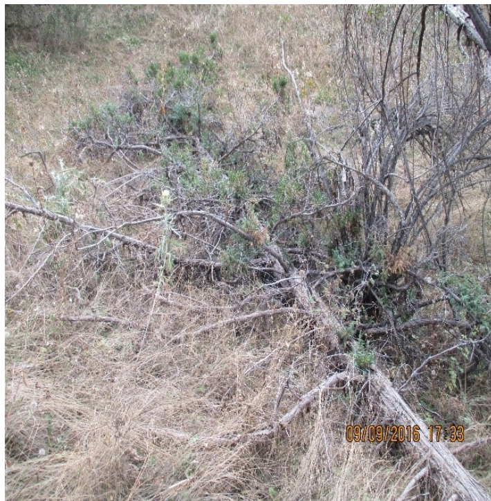
2-rasm. Archa tanasining chirish kasalligi