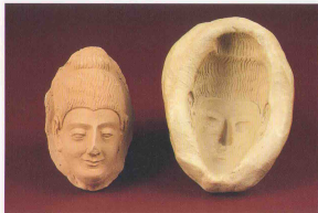
仏陀像頭部の型 カラコルム 4世紀