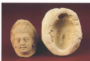
仏陀像頭部の型 オグチ/カラコルム 4世紀

中国における仏教の普及において、ソグド人の働きが大きな役割を果たしたが、しかしそれは独自にソグド人であることだけであった。彼らはインドと中国へ移住したソグド人商人とその子孫で、そこで仏教徒となった。特徴的