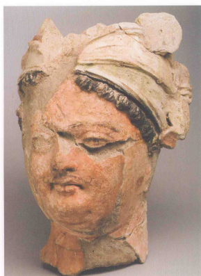
菩薩像 紀元5世紀/キルギスタン

は、等身大の仏陀像や菩薩像があった。城壁外の礼拝堂で発見されたばかりの貴人の頭部像に似た世俗的人物も、稀に見つかる。この考古学的遺跡で発見された彫刻の創造的特性は、世俗的人物や天竺など仏教の二次的形象に現れたが、仏陀や菩薩の像はきびしく規範的で、仏教がバクトリアに出現する前にガンダーラ美術で形成された範囲に属している。