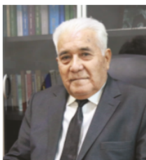
Ахмадали АСҚАРОВ, Низомиёи номидagi ТДПУ профессори, академик

олмади. Бир бутун Туркистон Дашти қипчоқ кўчманчи ўзбекларининг ўзаро урув-айиқоқ ва қўйилмай бошқарувага мойилликлари тўғрисида ягона Туркистон мамлакатининг унинг автохтон ўтроқ дилингизим тили аҳолиси уч хонлиққа бўлиниб кетди. Бирлашган ўзар, бирлашмаган тўзар халқ мақоли амалда намоен бўлиб, ягона Туркистон аста-секин Россия хомашё базасига, атеистик большевиклар мустамлакасига айланди.