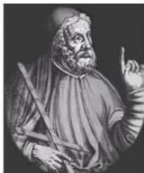
Клавдий Птолемей (100–165 гг. н. э.)