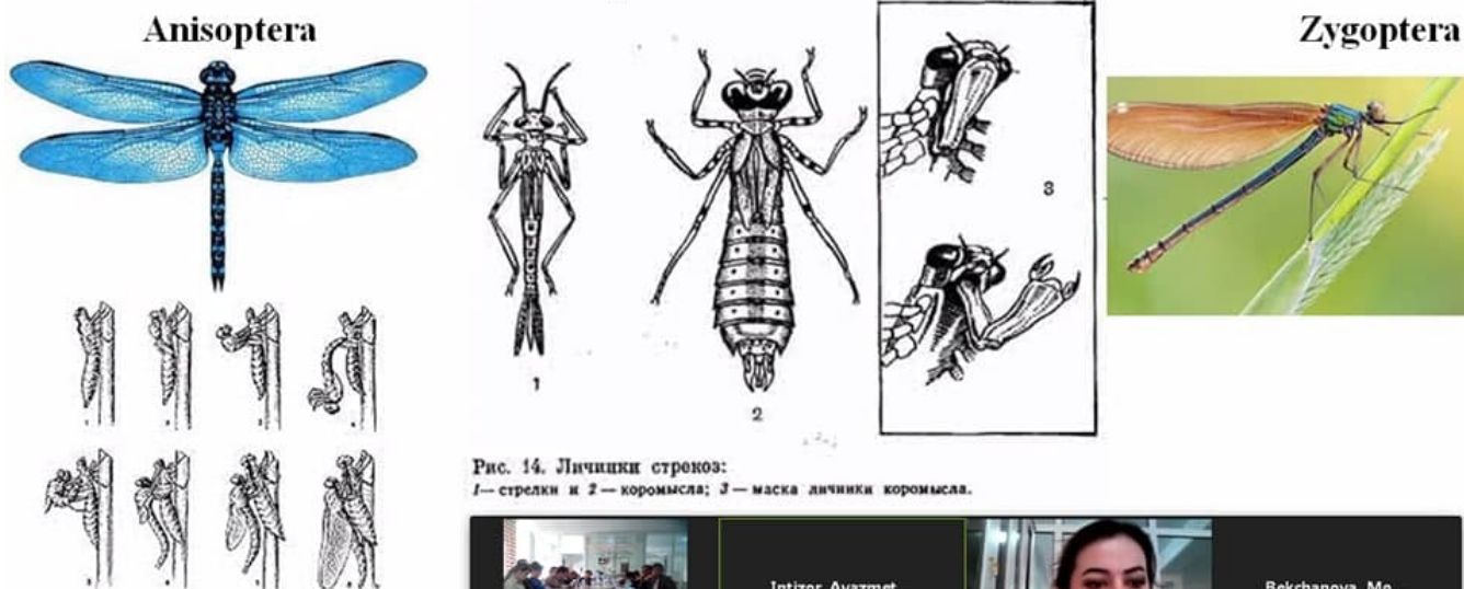
Рис. 14. Личинки стрекоз: 1— стрелки и 2— коромысла; 3— маска личинки коромысла.