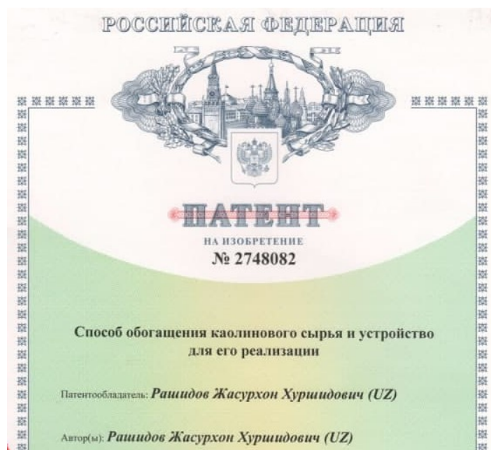
Способ обогащения каолинового сырья и устройство для его реализации