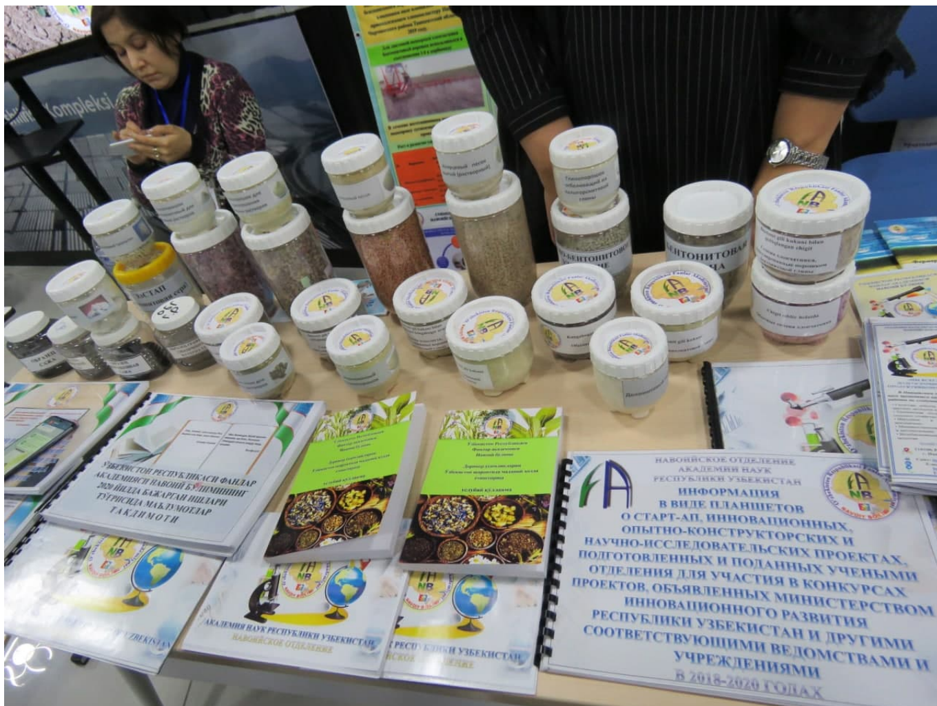
Forum 26-fevral kuni ham davom etadi.