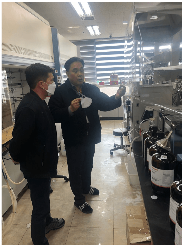
International Biological Material Research Centerdagi laboratoriya xonasi (Janubiy Koreya).