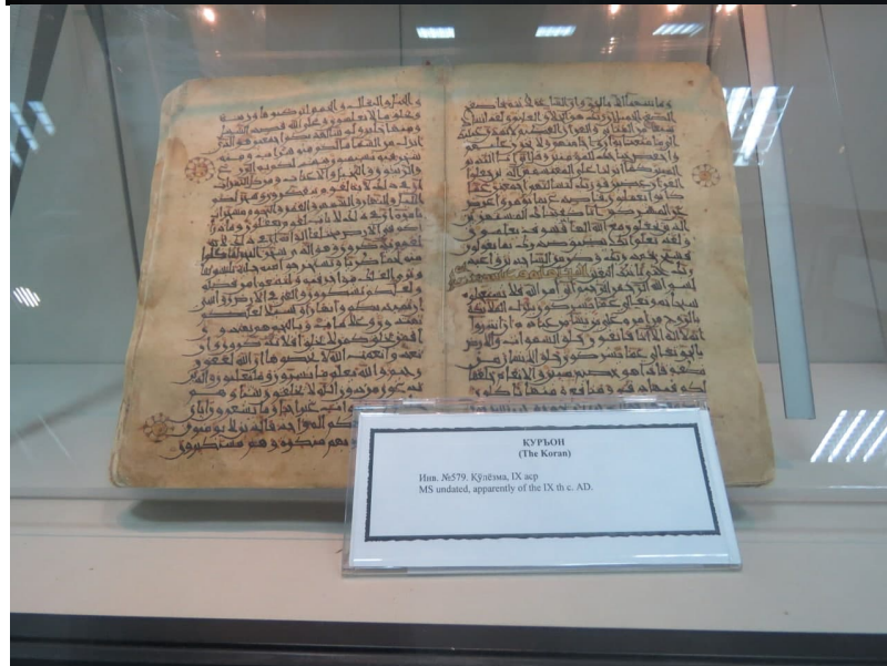
КУРЪОН (The Koran) Inv. №579, Кўлима, IX аср MS undated, apparently of the IX th. c. AD.