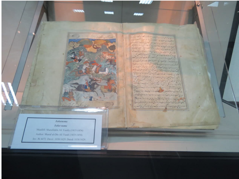
Zafarname Zafar-name Minalilil, Sharafidin Ali Yaqdli (1413-1454) Author: Sharaf al-Din Ali Yaqdli (1413-1454) Inv. № 4472, Davri: 1038/1629, Dandi: 1038/1629.