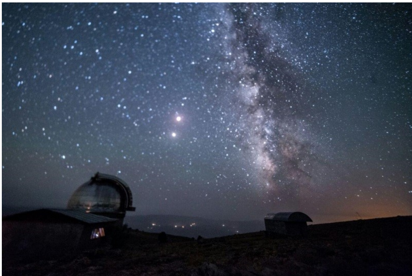
Шухрат Эгамбердиев, директор Институт астрономии АН РУз, академик.

Хорошо, что иногда случаются небесные явления, которые отвлекают нас от повседневных будней, и напоминают нам, что мир вокруг нас так изумительно прекрасен!