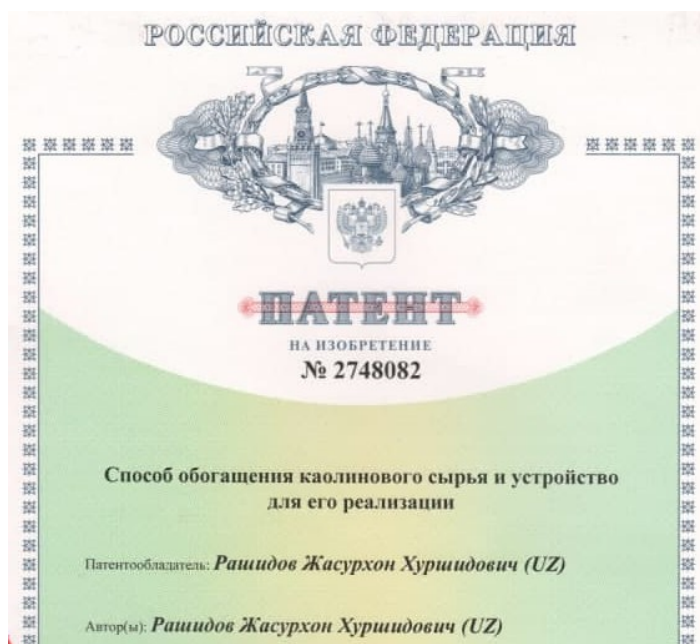
Способ обогащения каолинового сырья и устройство для его реализации