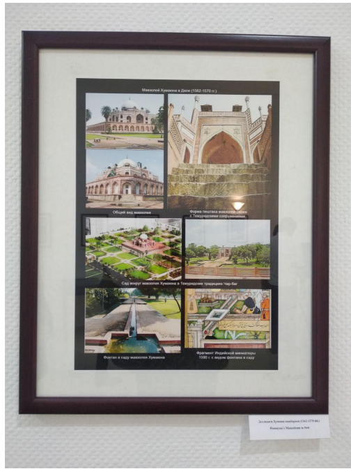
Мечеть Сулеймана в Давле (1562-1570 гг.). Фонтан в саду мечети.