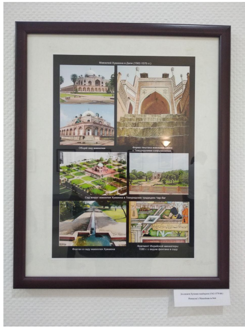
Миниатюры из кодекса Чаг-Бар (1780 г.)